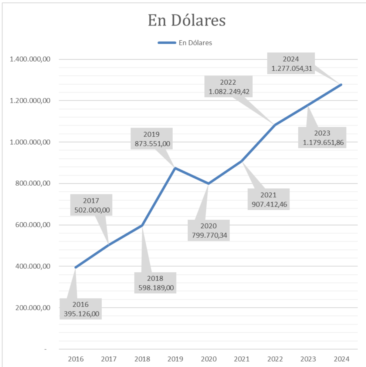
Gráfico No 2