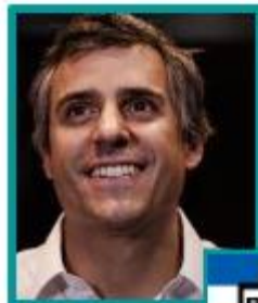
Carlos Calleja Partido Alianza Republicana Nacionalista