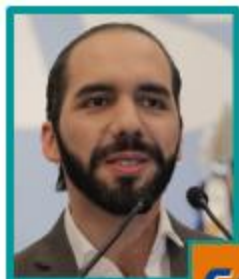
Nayib Bukele Gran Alianza por la Unidad Nacional

Para las elecciones presidenciales del 3 de febrero se inscribieron oficialmente cuatro candidatos, tres de los cuales lideran la intención de voto. A continuación encontrarán un perfil de ellos tres.